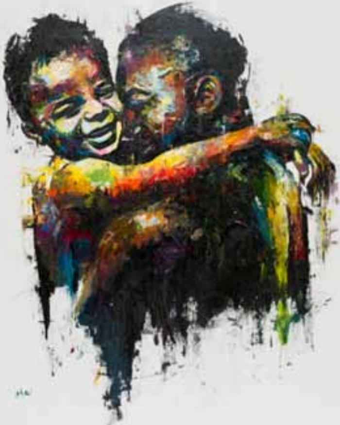
"Pai e Filho", por Shai Yossef