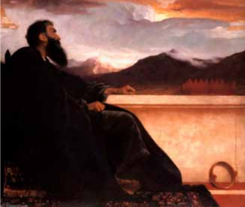
"Davi", por Frederick Leighton (1865)