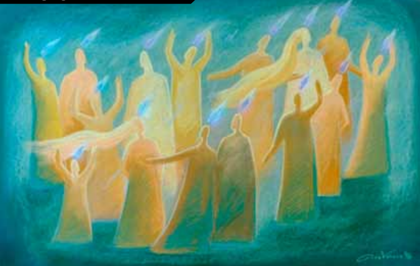
“O Dia de Pentecostes”, por Ain Vares (1996)