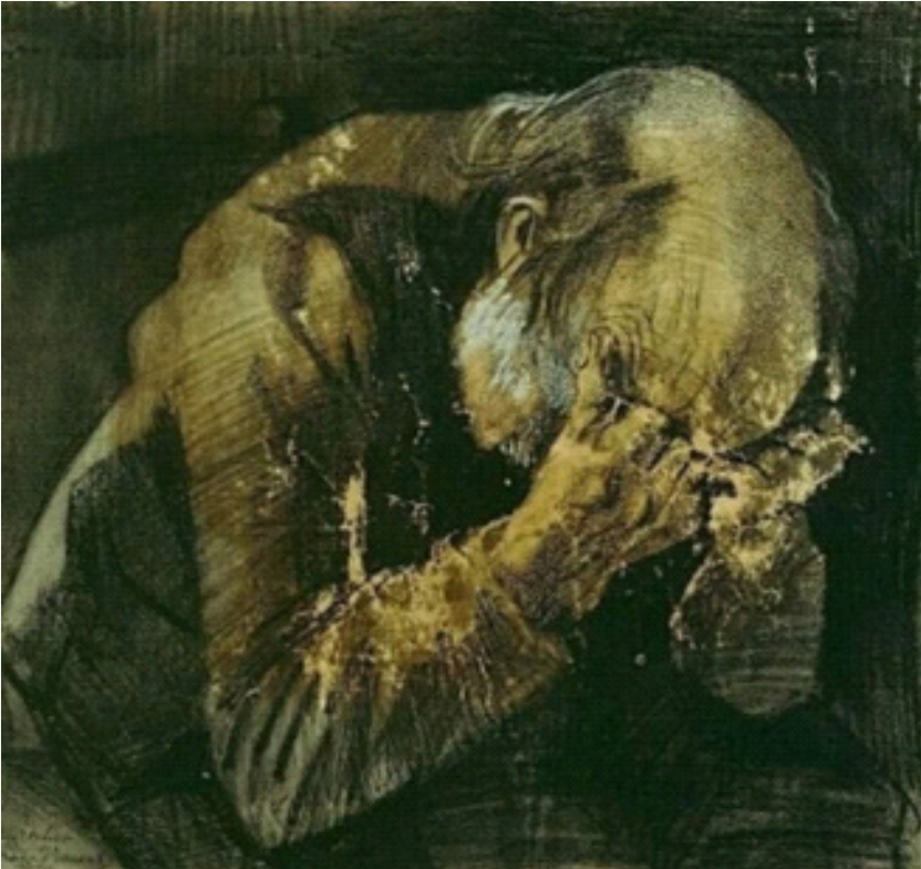
"Velho Arrependido", por Vincent van Gogh (1882)