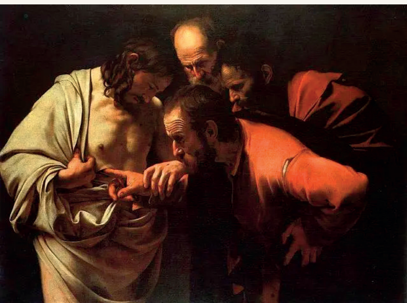
"A Incredulidade de Tomé", por Caravaggio (1602)