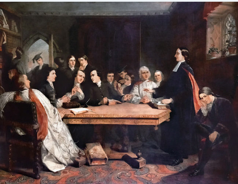
Clube Santo, a origem do metodismo ("John Wesley e Seus Amigos em Oxford", por Marshall Claxton, 1861)

Alfred de Musset , poeta e dramaturgo francês (1810-1857)