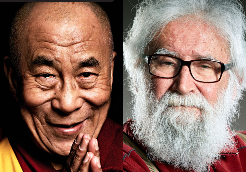
O Dalai Lama e Leonardo Boff