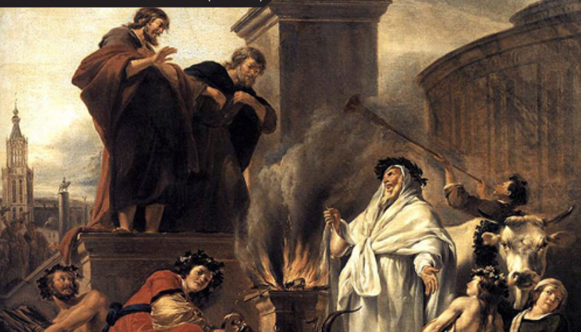
Discipulador e discipulado ("Paulo e Barnabé em Listra", por Nicolaes Berchem, 1650)