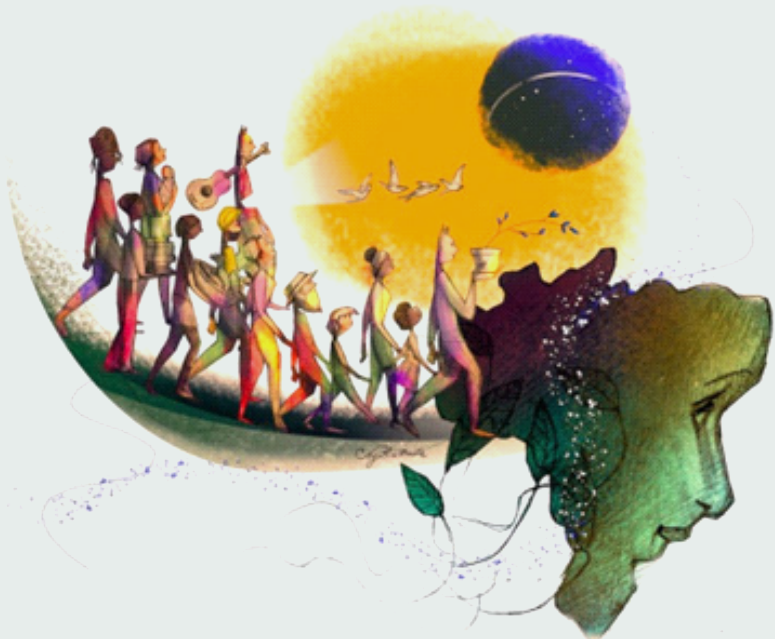
Democracia pelo bem comum (arte de Sérgio Ricciutto Conte)

tir sobre um dos temas mais importantes da atualidade no Brasil: democracia.