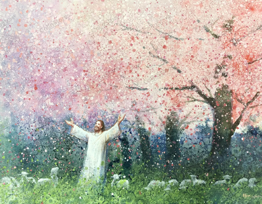
"Sementes de Bondade", por Yongsung Kim