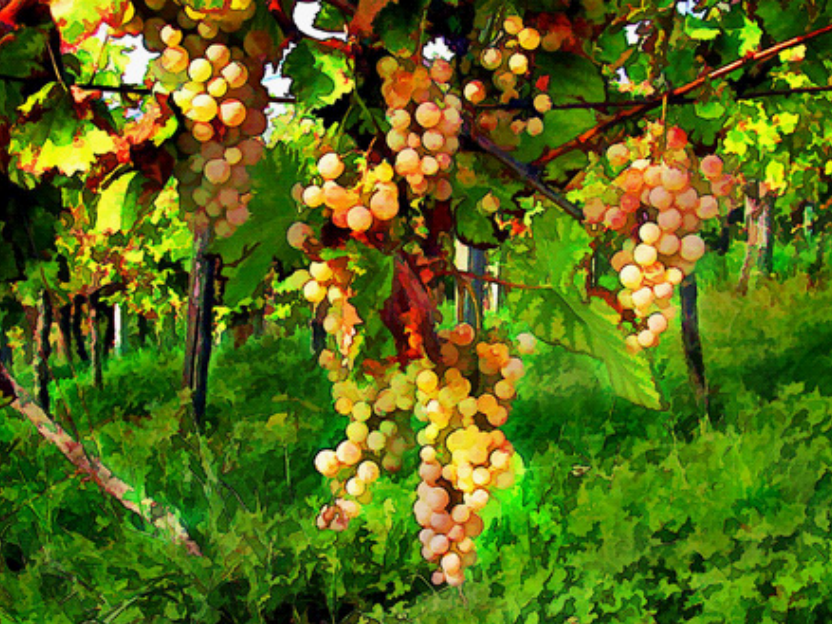
"Frutos Pendurados na Videira, por Elaine Plessner"

A fim de mostrar a impossibilidade de viver fora d'Ele, a palavra "permanecer" é repetida sete vezes nesse capítulo. Permanecer é estar unido a Ele como o ramo está unido à árvore. A vida d'Ele em nós e a nossa vida n'Ele resultam numa existência produtiva (15:4-5). É impossível o ramo ligado à videira não dar fruto. O que Cristo quer ensinar quando diz que o ramo que não dá fruto é lançado fora é que não há vida fora da videira. Não há vida à parte de Cristo, porque a fonte original da vida é Cristo: "Quem tem o Filho, tem a vida" (1 Jo 5:12). Essa vida deve se reproduzir por meio daqueles que a receberam, para que muitas outras venham a nascer. Jesus doou a Sua vida na morte e nos chama para "cair na cova da vontade de Deus", pois, "se o grão de trigo, caindo na terra, não morrer, fica ele só; mas, se morrer, produz muito fruto" (Jo 12:24).