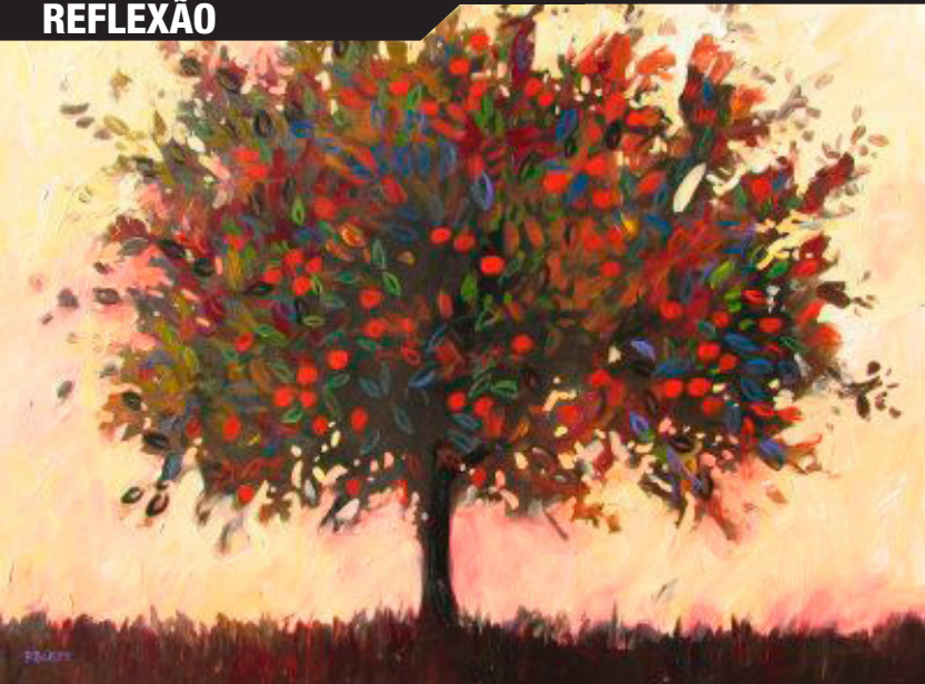
“Macieira Abstrata”, por Patty Baker