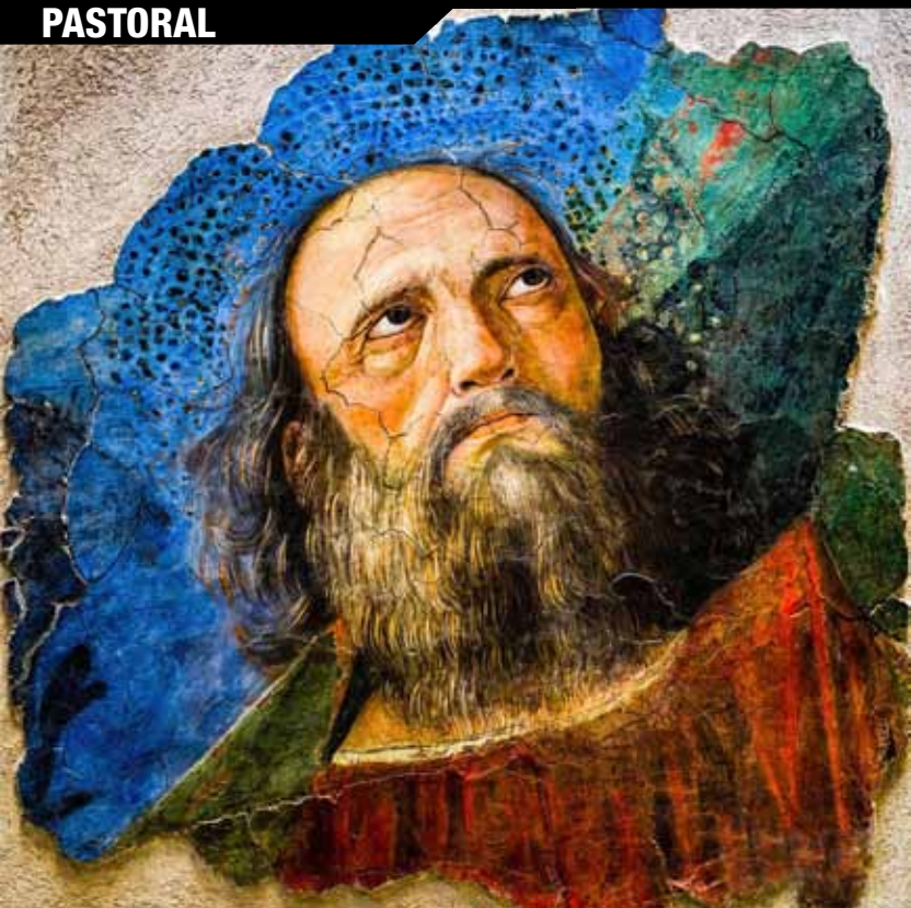
Imitador de Cristo ("Apóstolo Paulo", por Melozzo da Forti)