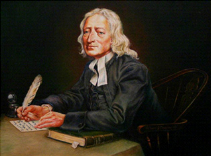
Wesley e a Bíblia: homo unis libri (homem de um único livro)

meiro salmo é uma descrição de como mulheres e homens piedosos se parecem com árvores plantadas junto a ribeiros de águas e que meditam sobre a lei de Deus dia e noite, isto é, estão pensando sobre o que a Bíblia revela a respeito da vontade e do plano de Deus para nossas vidas. Para fazer isso, é preciso estudar a Palavra de Deus, que é a Bíblia Sagrada.