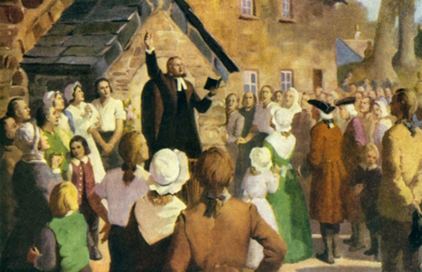
John Wesley prega em Epworth, Inglaterra, sua cidade natal