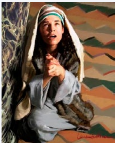
"Ana Ora por um Filho", por Lars Justinen

Como é importante confiarmos no agir de Deus! A você, mãe, que tem sido provada de muitas maneiras, ore, persevere e acredite na intervenção divina. Deus vai trazer de volta aquilo que é seu, pois Ele tem visto suas lágrimas.