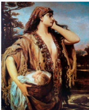
"Joquebede e Moisés", por Pedro Américo

nasceu, mas não pôde ficar de imediato sob os seus cuidados. Porém, a intervenção de Deus foi tão precisa que Joquebede teve a oportunidade de cuidar de seu filho até ele crescer. Segundo o decreto de Faraó, todas as crianças do sexo masculino deveriam morrer ao nascer (Ex 1:16). Então, nasce Moisés, um menino muito formoso. Sua mãe o esconde por três meses. Não podendo ficar com ele por mais tempo, pois os egípcios poderiam matá-lo, ela o coloca dentro de um cesto de junco e o larga no Rio Nilo. Miriam, sua irmã, a pedido da mãe, fica observando de longe o que haveria de acontecer. A filha de Faraó e suas donzelas, que passeavam pela beira do rio, logo pegam a criança, que chorava muito (Ex 2:5).