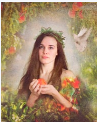
"Eva", por Mandy Jane Williams

O Dia das Mães, que comemoramos neste domingo, é uma data em que se homenageiam as mães e a maternidade. Em alguns países, é comemorado no segundo domingo do mês de maio, como no Brasil e na Irlanda. Em Portugal, é comemorado no primeiro domingo de maio. Segundo a Wikipédia, mãe, também chamada de nai (neologismo usado em certas regiões da Galiza, que ganhou conceito de mãe), genitora, progenitora ou ainda geradora é o ser do gênero feminino que gera uma vida em seu útero como consequência da fertilização. Mãe é também, para todos os efeitos, aquela pessoa do gênero feminino que adota, cria e cuida de uma criança gerada por outrem que, por alguma razão, não pôde ficar com seus pais. A verdade é que o Dia das Mães é uma data que deve ser comemorada todos os dias.