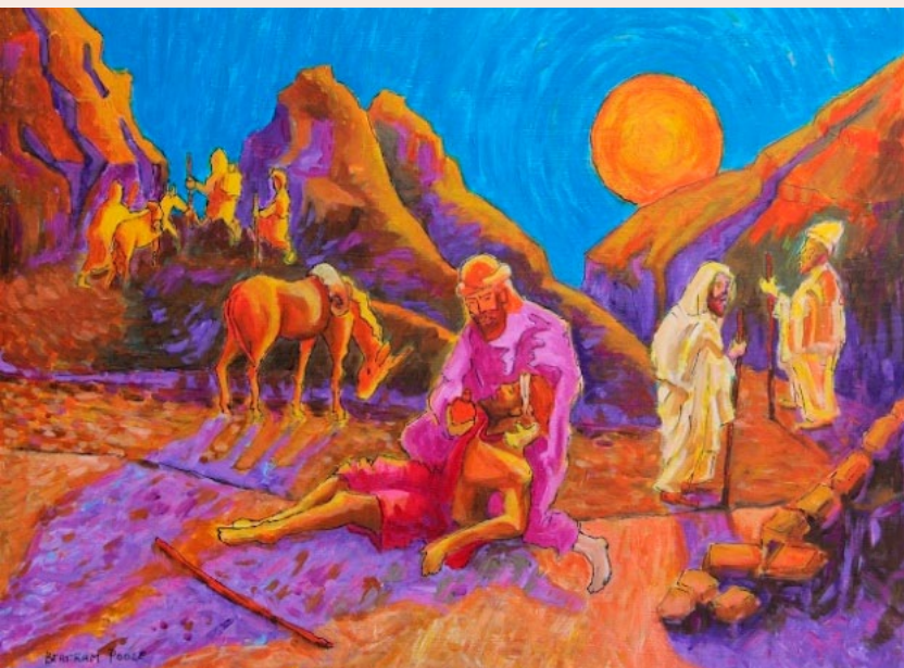
"O Bom Samaritano", por Bertram Poole

Ariano Suassuna , dramaturgo, romancista e poeta paraibano (1927-2014)