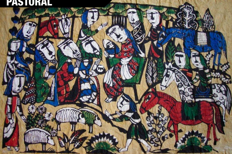
“Natividade” (Sadao Watanabe)