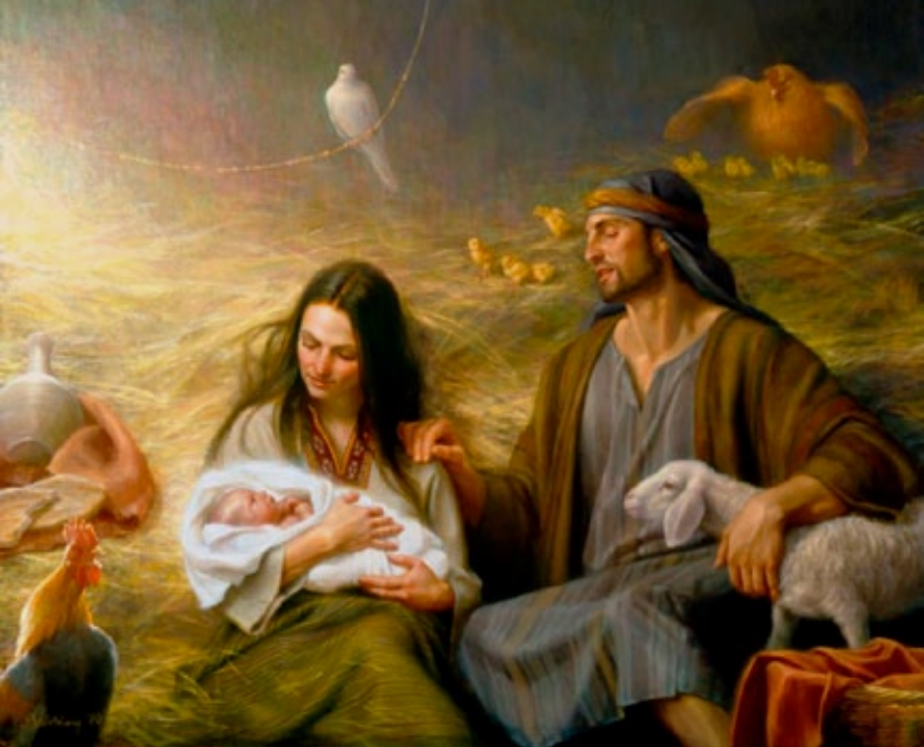
"O Salvador Nasceu", por Joseph Brickey

data fixa. Costuma ser próximo de 22 de dezembro, mas pode cair até no dia 25.