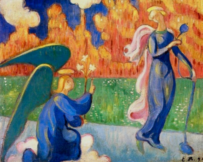
"Anunciação", por Emile Bernard (1890)