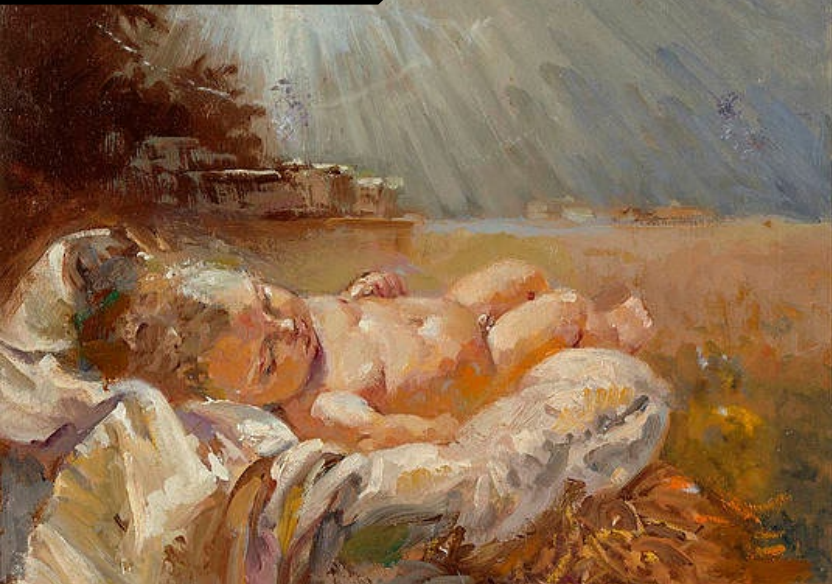
“Menino Jesus”, por Hal Frenck