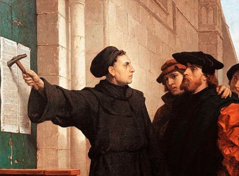
"Martinho Lutero Fixa Suas 95 Teses na Porta", por Ferdinand Pauwels (1872)

reliquias e peregrinações aos lugares "santos", nos quais se vendiam ossos de "santos" e pedaços da "legítima cruz de Cristo". Quem visse uma relíquia ganhava milhares de anos a menos no Purgatório. Uma piada corrente dizia que, dos 12 apóstolos, 18 estavam enterrados na Espanha. E cada "túmulo" de "santo" ou "apóstolo" era lugar de peregrinação, desde que você pagasse para vê-lo ou tocá-lo.