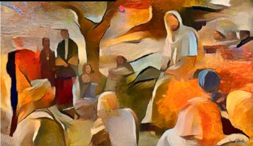
O Mestre ensina Seus discípulos ("Vinde a Mim", por Wayne Pascall)