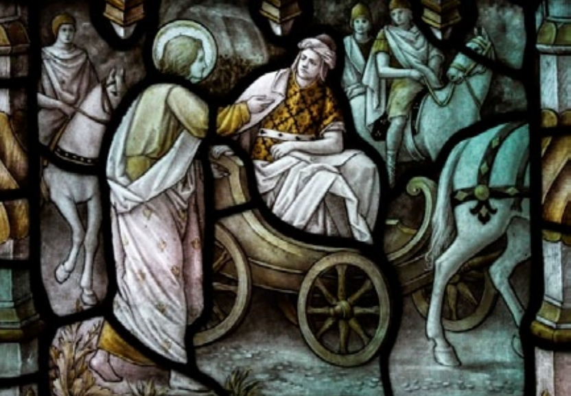
"Filipe e o Eunuco Etíope" (detalhe de vitral da Catedral de Lancaster, na Inglaterra)