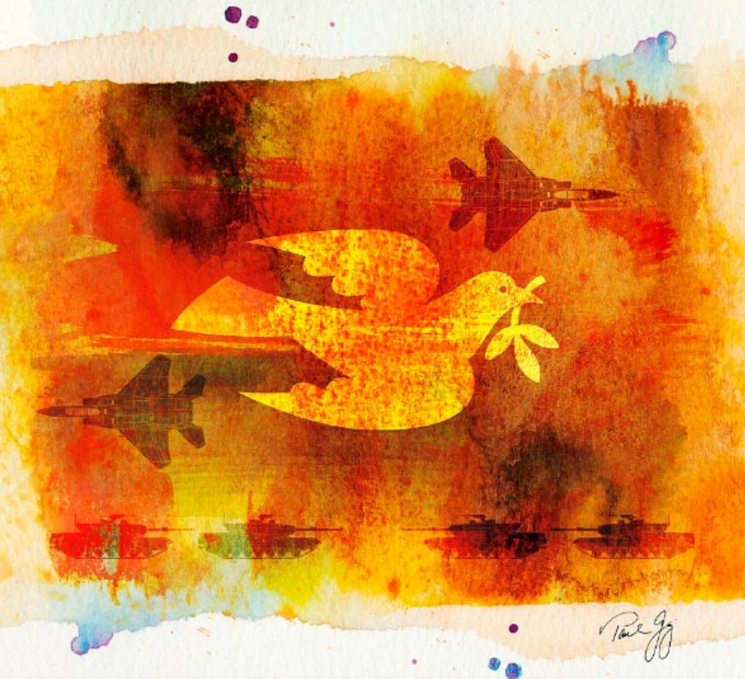
“Paz, Guerra, Paz, Guerra”, por Paul Gaj (2010)