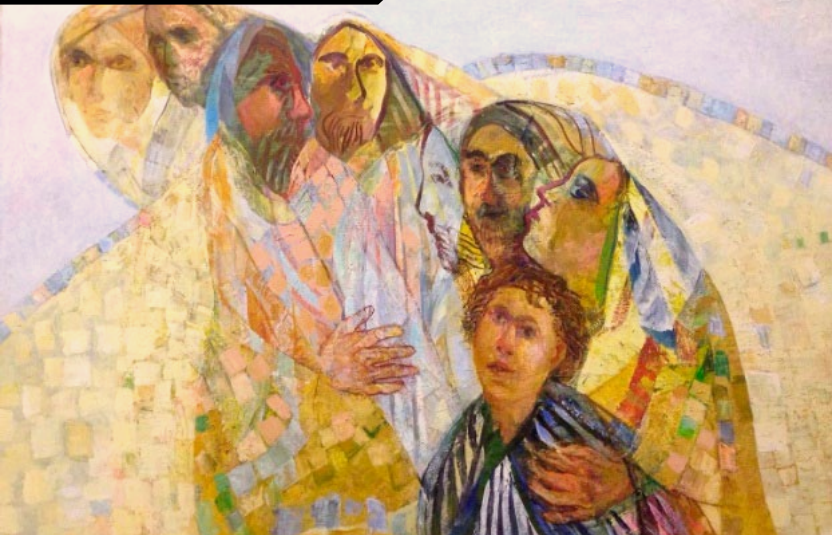
“José e Seus Irmãos”, por Avi Ezra