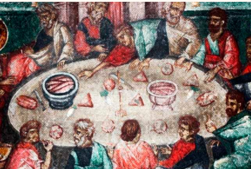
A Igreja Primitiva: pequenos grupos