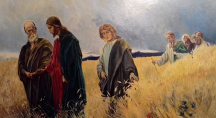
"Jesus e Seus Discípulos", por S. Giraud