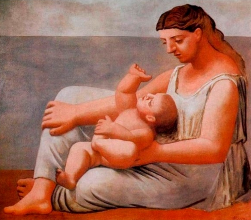
"Mãe e Filho na Praia", por Pablo Picasso (1921)