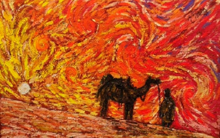
"Décimo Segundo Dia no Deserto, Conexão com Deus", por João Miranda (2020)