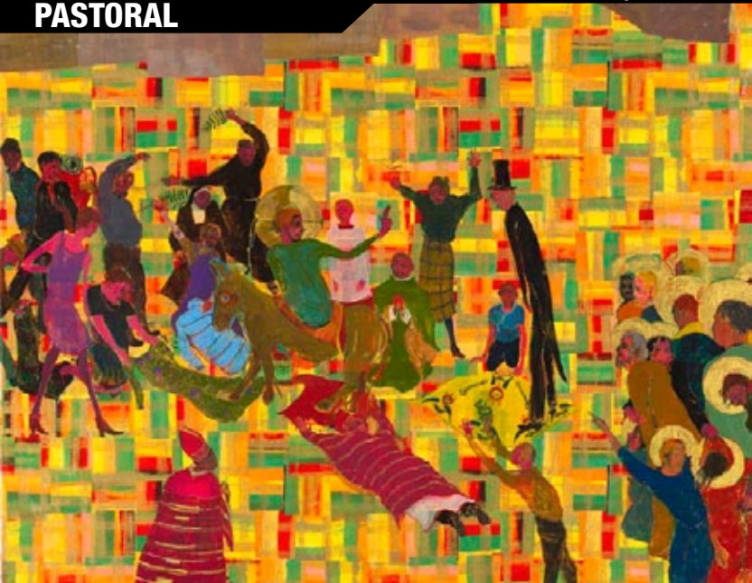
“Domingo de Ramos”, Kai Althoff