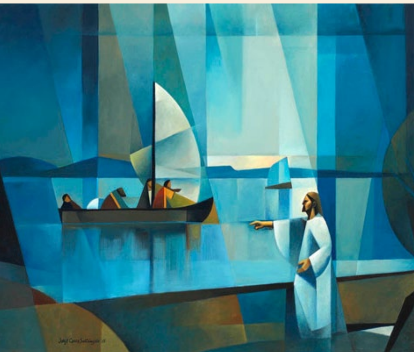
"O Chamado", por Jorge Cocco Sant'angelo