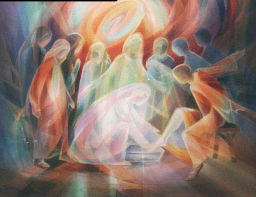
“Jesus Lava os Pés dos Discípulos”, por Leszek Forczek