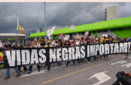
Protesto em frente ao Carrefour de Porto Alegre.

20 de novembro de 2020 - Dia Nacional da Consciência Negra