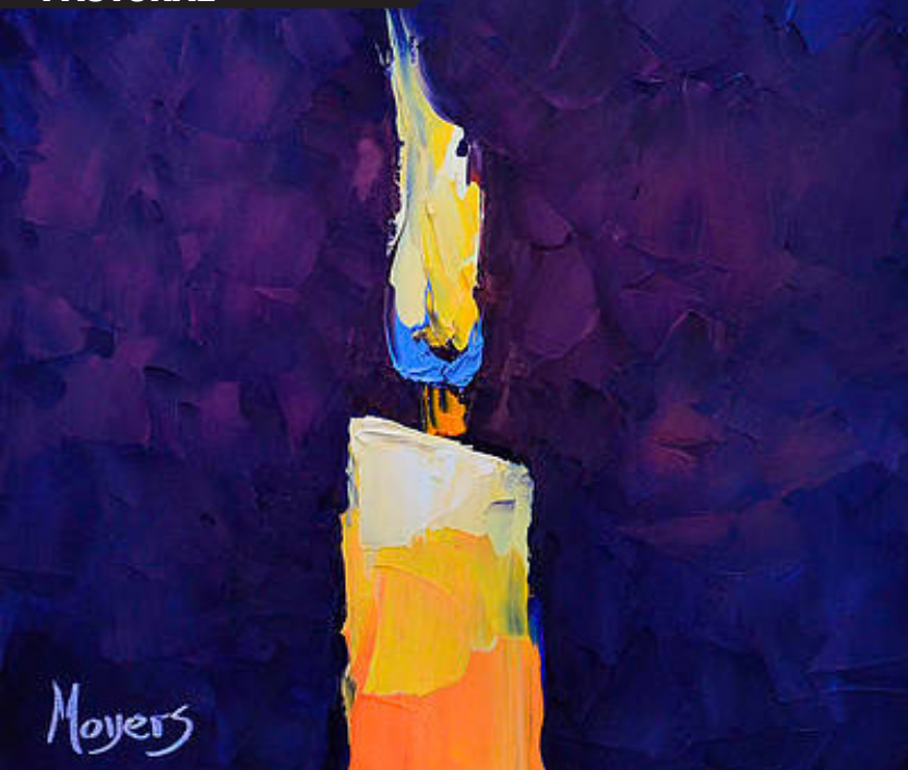
“Brilho”, por Mike Moyers – Primeiro domingo do Advento