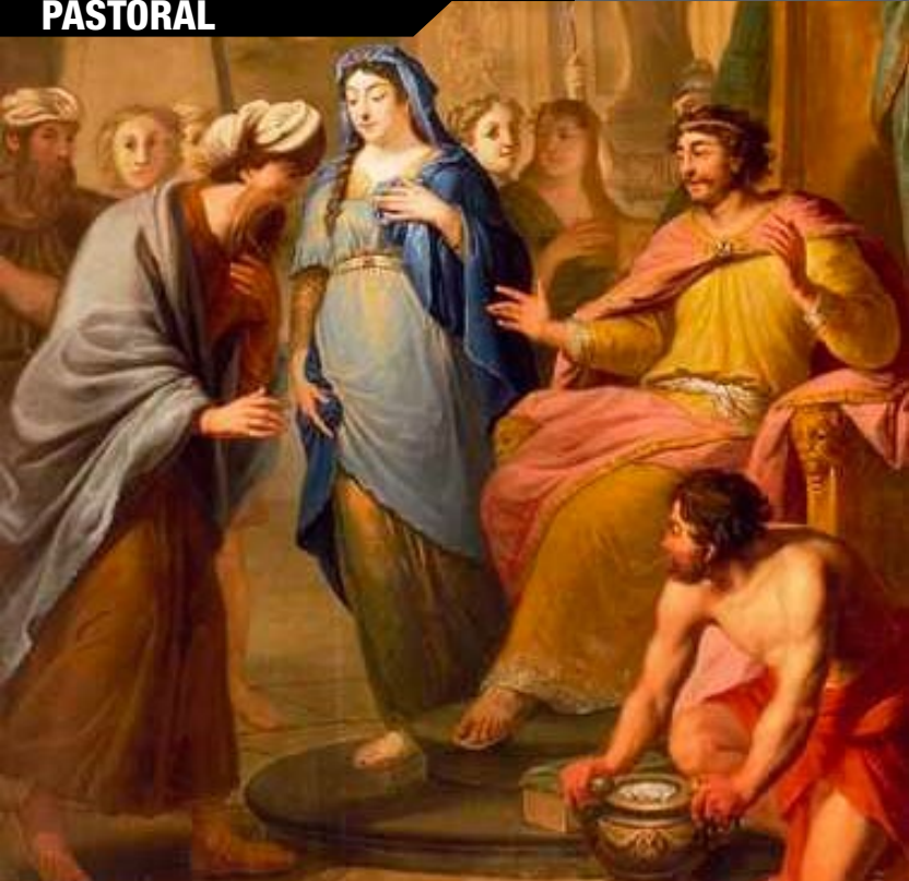
"Abimeleque Devolve Sara a Abraão", por Elias van Nijmegen (1731)