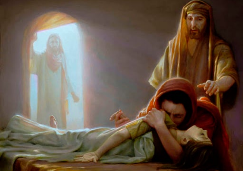
"A Filha de Jairo", por Joseph Brickey (1973)