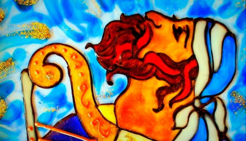
"Rei Davi e Sua Harpa", por Hilary Sylvester (detalhe)