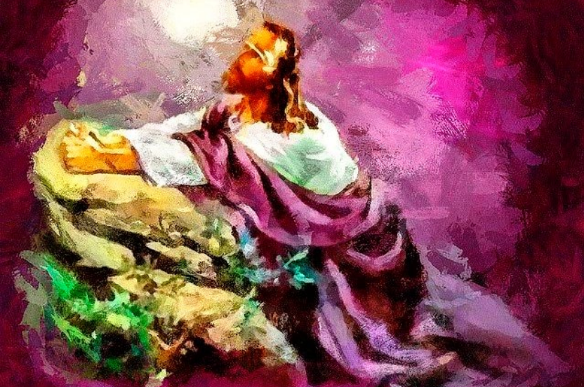
"Jesus Orando", por Bob Smerecki