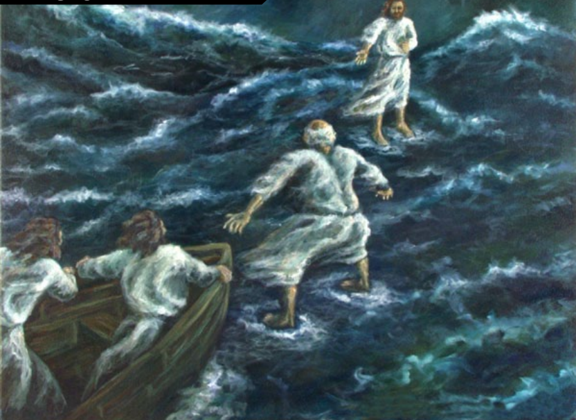
“Caminhar pela Fé: Jesus e Pedro Andam sobre as Águas”, por Rebecca Brogan