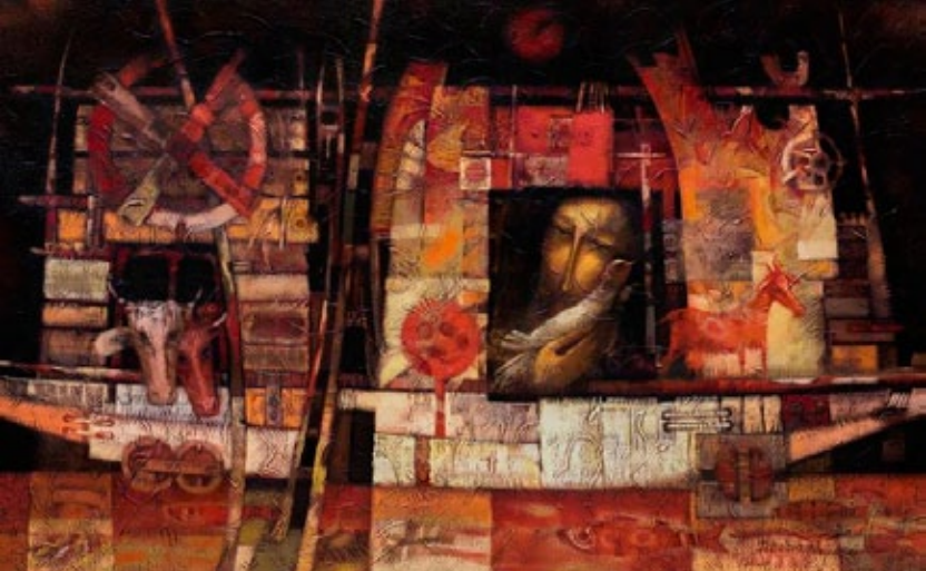
"A Arca de Noé", por Dumitru Bolboceanu