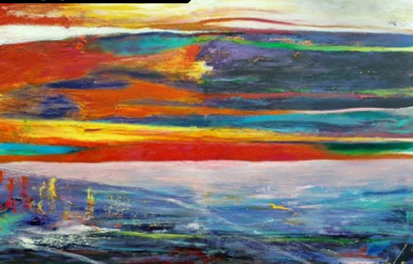
“O Silêncio de Deus”, por Tony Henson