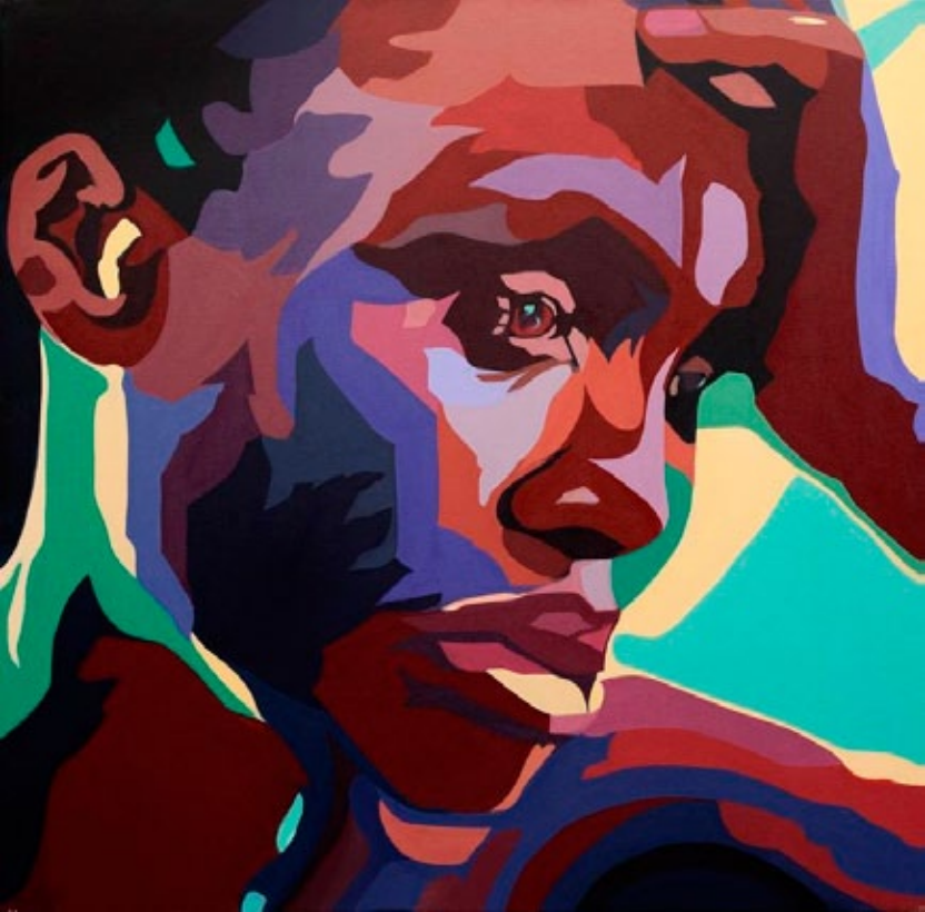
"Preocupação", por Amaya Iturri