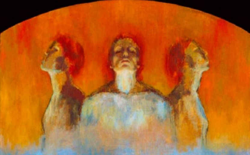
"Sdraque, Mesaque e Abede-Nego", por J. Kirk Richards