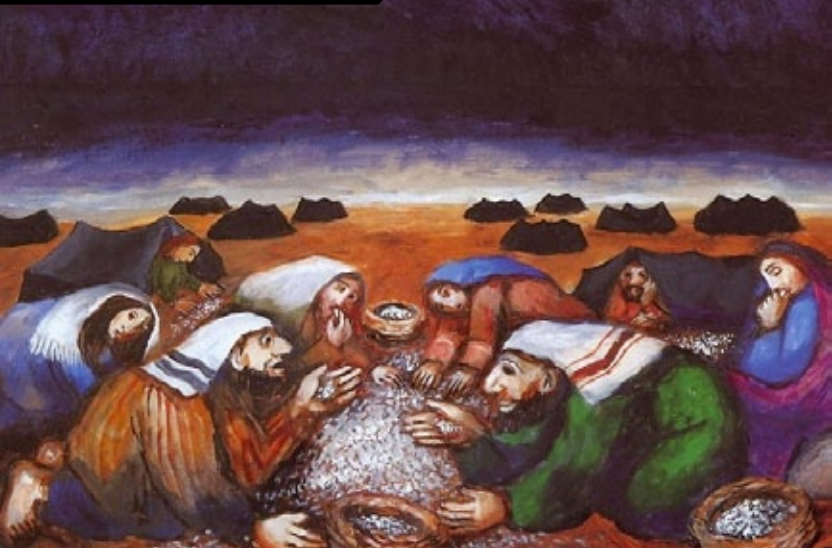
“Maná no deserto”, por Sieger Köder