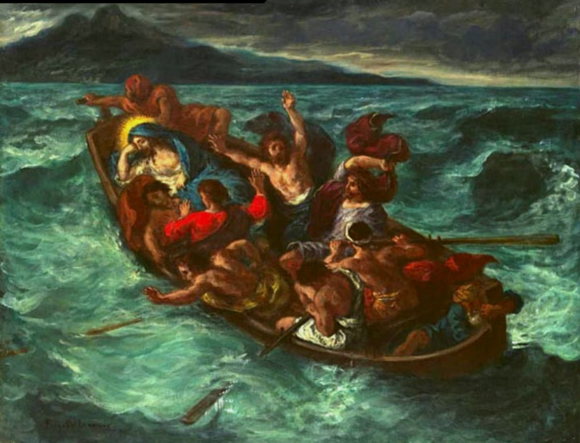
“Cristo Dorme durante a Tempestade”, por Eugène Delacroix (1853)