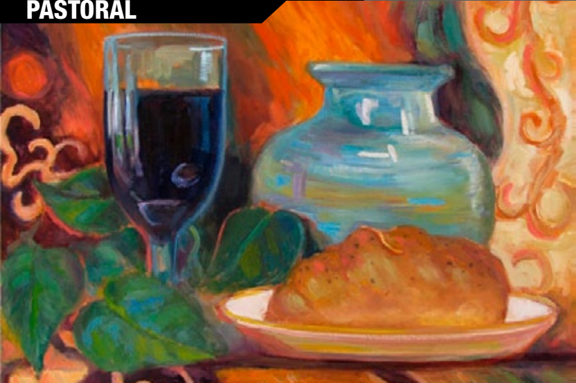
"Santa Ceia", por Nora Sallows