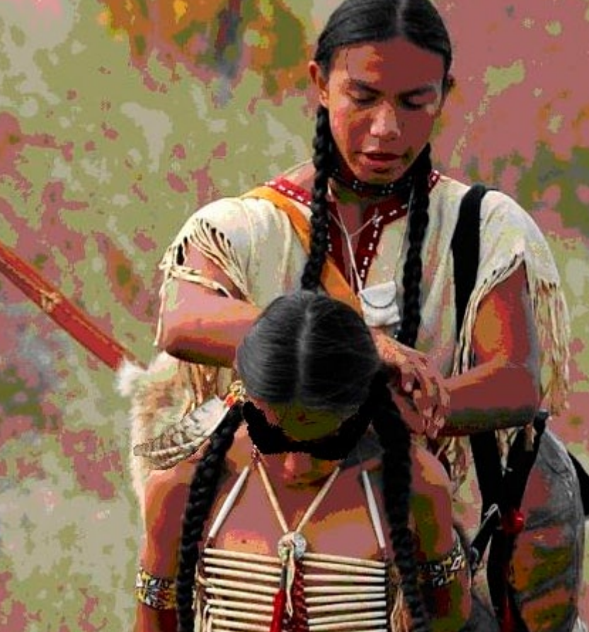
Índigenas norte-americanos: a paternidade é sagrada