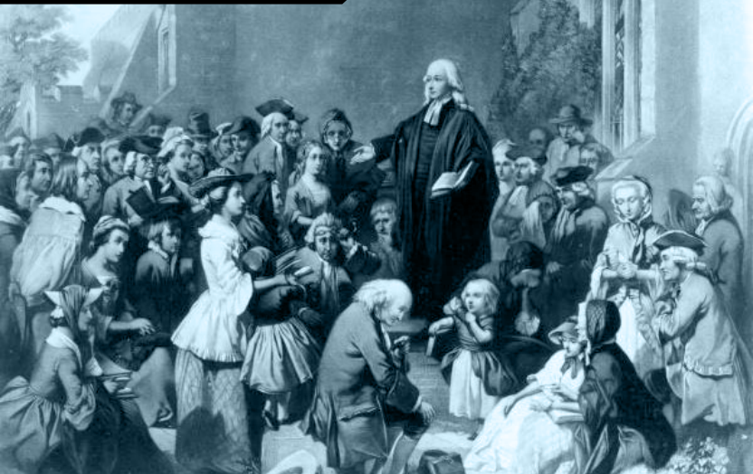
John Wesley pregando (gravura séc. XIX)