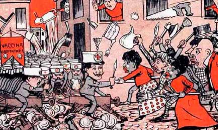
A Revolta da Vacina no Rio de Janeiro, em charge da revista "O Malho" (1904)