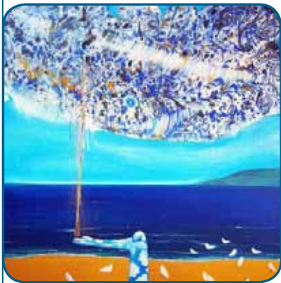
"A Graça de Deus", por Angela Gabriel

"Porque o pecado não terá domínio sobre vós; pois não estais de baixo da lei, e sim da graça" (Rm 6:14).