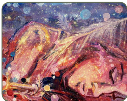
"À Sombra das Tuas Asas", por Daniel Gerhartz

O Salmo 36 foi escrito por Davi. O poeta-mor de Israel faz um contraste entre os ímpios e os que conhecem a Deus. Aqueles não têm temor de Deus; estes se aninham debaixo das sombras de Suas asas. Aqueles abrigam a transgressão no coração; estes fartam-se da abundância da casa de Deus.