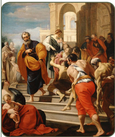
"Pedro Cura os Enfermos com Sua Sombra", por Laurent de La Hyre (1650)

"Descendo a uma cidade samaritana, Filipe proclamou a Mensagem do Messias. Quando o povo ouviu sua pregação e viu os milagres – claros sinais da ação de Deus –, eles se apegaram a cada palavra. Pessoas que não podiam ficar em pé nem andar foram curadas naquele dia. Os espíritos malignos protestavam e faziam estar-dalhaço, mas eram expulsos. Houve muita alegria naquela cidade!" (Atos 8:3-8 – A Mensagem: Bíblia em Linguagem Contemporânea).