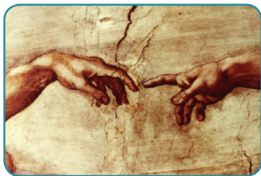
“A Criação do Homem”, por Michelangelo (detalhe)

Aditar em quem Ele é. Por esse motivo a palavra “fé” é usada tantas vezes nas Escrituras.