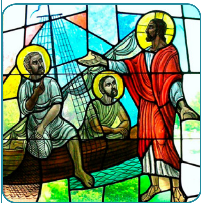
"Eu vos farei pescadores de homens" (vítrol)

Certamente, o momento mais marcante em nossa vida é quando tomamos consciência do que Cristo fez por nós na cruz, nos arrependemos dos nossos pecados e confessamos Jesus Cristo como nosso único e suficiente salvador. Para nós, metodistas, esse momento que chamamos de experiência com Deus é imprescindível, muito embora não estabeleçamos nenhum padrão ou modelo a ser seguido ou chamado de correto.