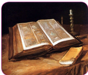
“Natureza-Morta com a Bíblia”, de Vincent van Gogh (1885)

“Toda a Escritura é inspirada por Deus e útil para o ensino, para a repreensão, para a correção, para a educação na justiça, a fim de que o homem de Deus seja perfeito e perfeitamente habilitado para toda boa obra” (2 Timóteo 3: 16,17).